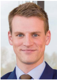
Autor: Erik Somssich, Account Manager msg life

Gleichzeitig erwarten Endkunden von ihrem Versicherer dasselbe Tempo und dieselbe Servicequalität, die sie von großen digitalen Playern wie Amazon kennen. Ein nahtloser, kanalübergreifender Service sowie die Schaffung neuer, an der Lebenswelt der Kunden orientierter Angebote werden immer wichtiger.