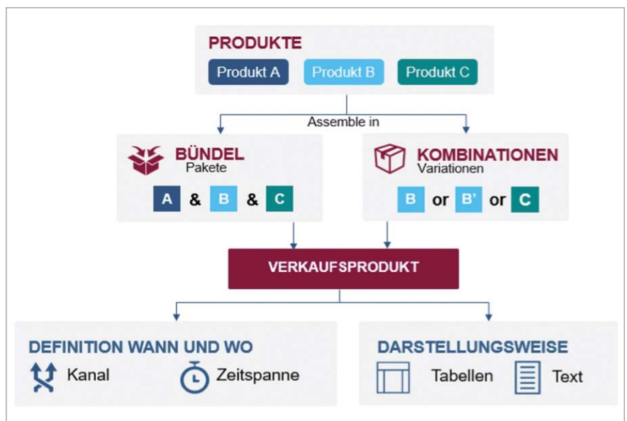
Sales-Konfigurator zur einfachen Erstellung von spartenübergreifenden Angebots- und Produktvarianten

Aus der Sicht des Kunden zu denken bedeutet auch, offen dafür zu sein, Gesetzmäßigkeiten der Branche zu hinterfragen. So sind zum Beispiel viele Verbraucher regelmäßig mit der strikten Trennung von Versicherungsprodukten nach Sparten und der Frage, welche Risiken in welchem Produkt abgedeckt sind, überfordert. Auch die Vielzahl von Produkten, Tarifen, Konditionen sowie die Fachterminologie erschweren es, die Angebote und Bedingungen zu verstehen. Versi-